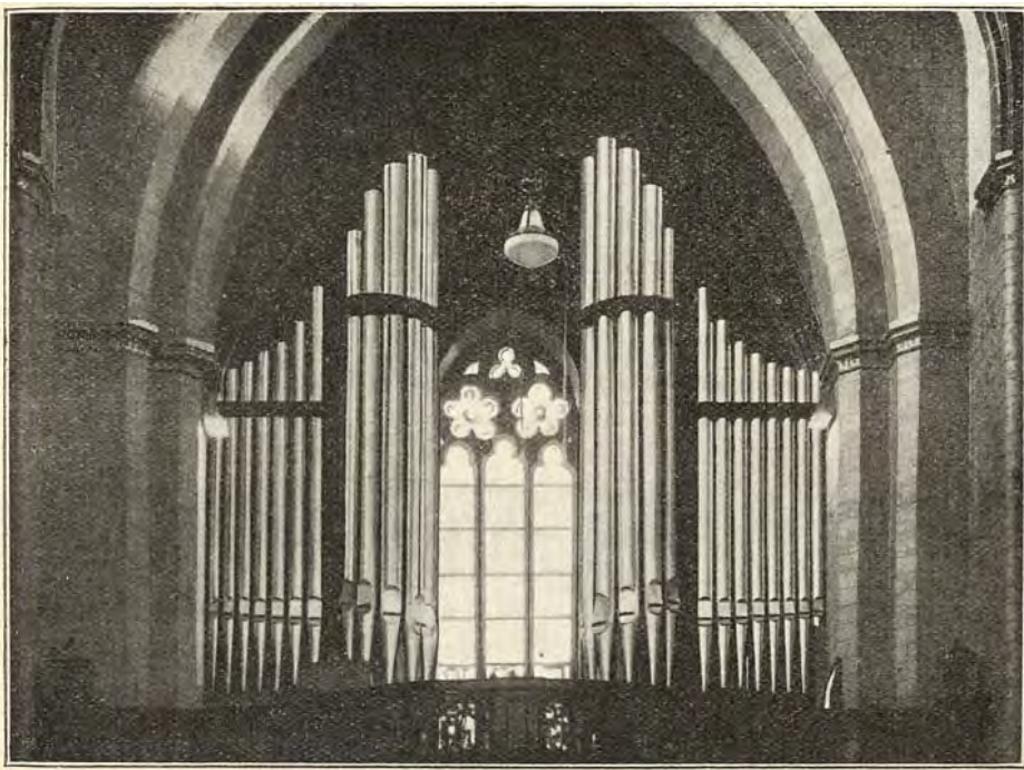
ORGEL UIT DE ST. PETRUS-KERK TE SITTARD. (FIRMA VERMEULEN).

ten natuurlijk speciale eischen stellen van wege het klimaat.