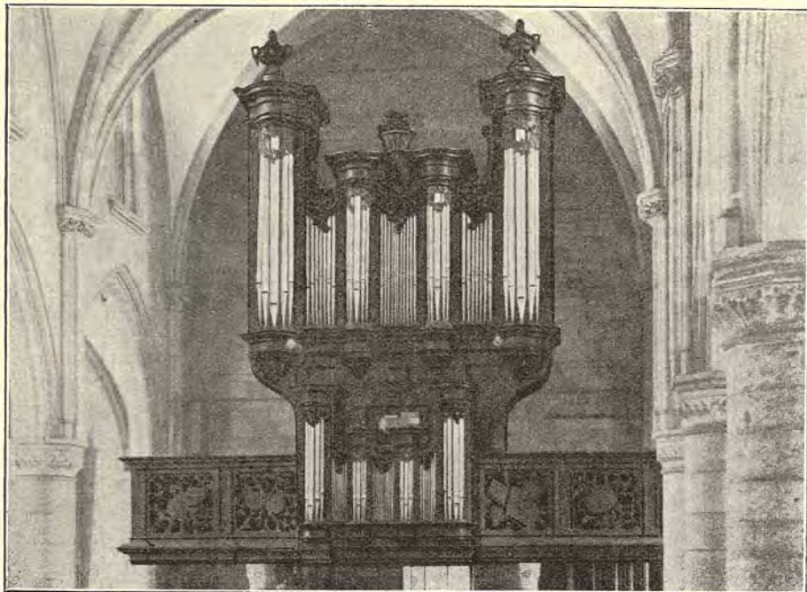
ORGEL UIT DE KERK VAN BOCHOLT (B.), GEBOUWD DOOR FIRMA VERMEULEN (1780).

deze firma gemaakt, n.l. in 1730, noemen wij het oude orgel van Bocholt (B.) Wij plaatsen hier een afbeelding van het orgel, zooals het nu nog bestaat en terecht bewonderd kan worden.