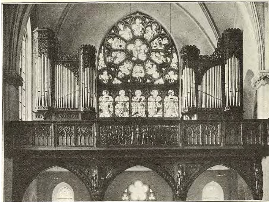
ORGEL UIT HET SANATORIUM TE HEERLEN. (FIRMA VERMEULEN).

Ook het buitenland steekt al evenzeer de lof-trompet over deze Limburgsche industrie en sedert eenige jaren bouwt men zelfs de z.g. tropen-orgels voor onze beide Indië's, welke instrumen-